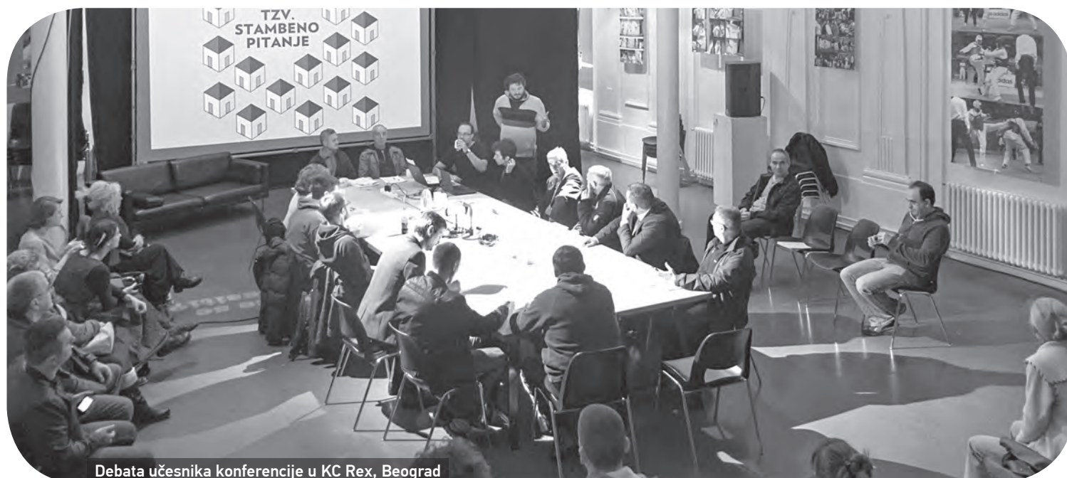
Debata učesnika konferencije u KC Rex, Beograd