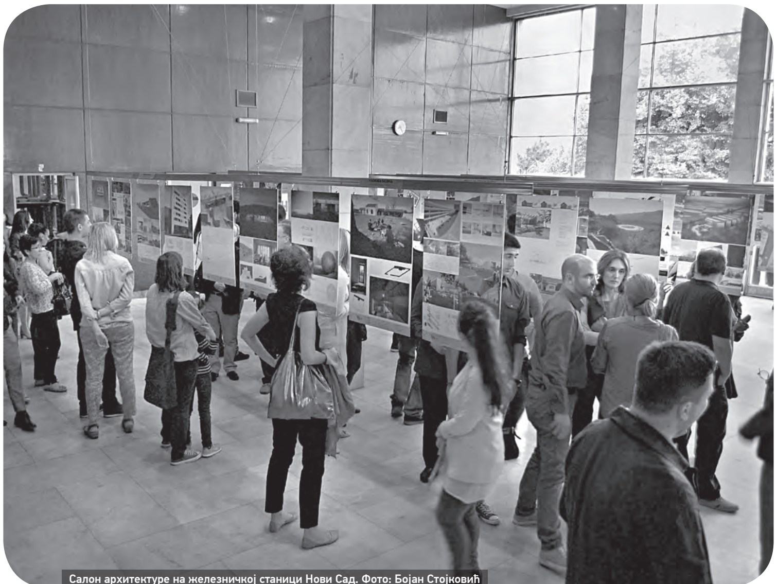
Салон архитектуре на железничкој станици Нови Сад.