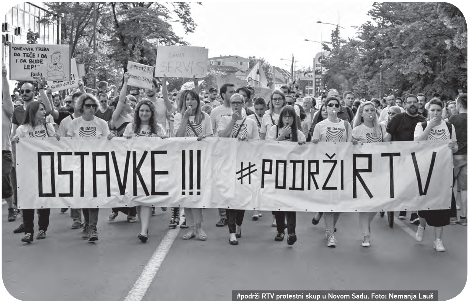
#podrži RTV protestni skup u Novom Sadu.