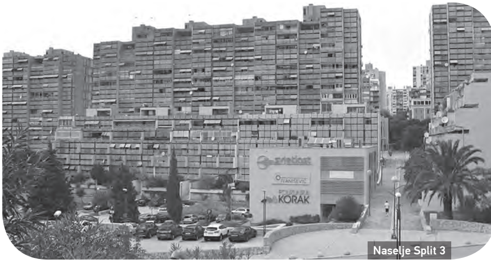
Naselje Split 3

P romjene titulara vlasništva nad nekretninama u Hrvatskoj obilježio je jedan značajan diskurzivni međukorak čije se posljedice vuku do danas: ne privatizira se društveno, već državno vlasništvo, ne „naše“ već „nečije“. Taj je odmak, između ostalog, na četvrt stoljeća uglavnom uspješno osigurao distancu između građana i mjesta koja naseljavaju i koja su konačno oni sami (ili njihovi preci) izravno gradili. Gotovo je potpuno izbijena svijest o kolektivnom i javnom interesu, pa glasnija ili sramežljivija traženja zaštite nekog prostora u interesu susjedstva ili grada redovito nailaze na nerazumijevanje šire populacije, a na korist spekulativnih. Prostorno se planiranje u Hrvatskoj odvojilo od društvenog planiranja, nije se prilagodilo aktualnom političko-ekonomskom sustavu i globalnim promjenama, a čak je izgubilo i interdisciplinarni okvir koji se u nekoj mjeri razvio u jugoslavenskoj praksi.