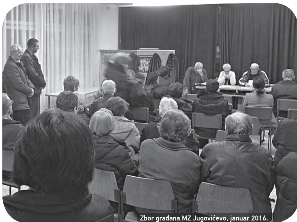
Zbor građana MZ Jugovićevo, januar 2016.

▶ Ali, gde su naše komšije sada i šta se dešava sa mesnom zajednicom? Kako stoje stvari sa potencijalnošću samoangažovanja građana i otvorenih mesnih zajednica?