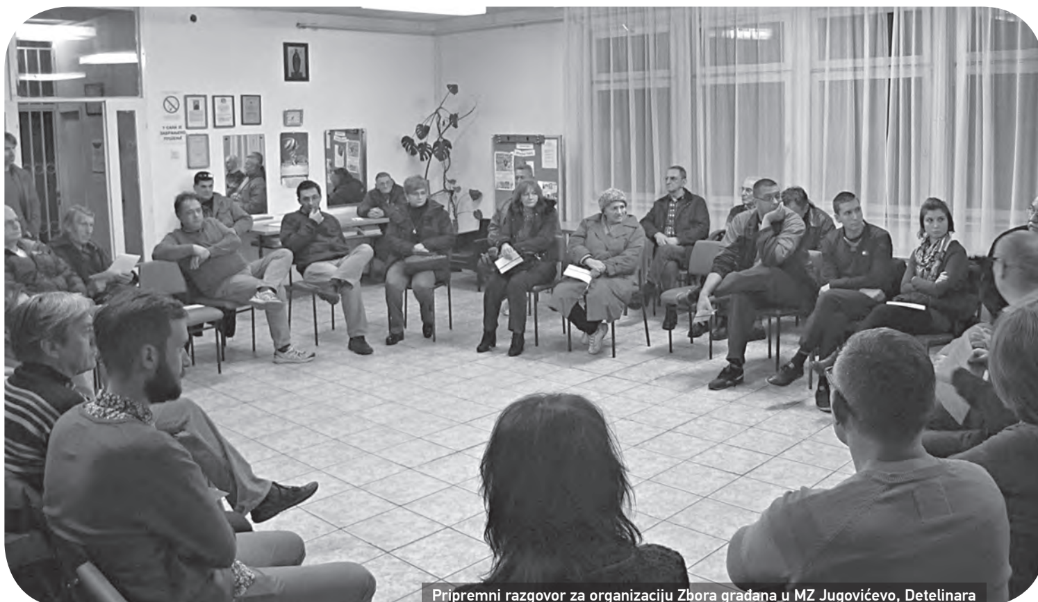
Pripremni razgovor za organizaciju Zbora građana u MZ Jugovićevo, Detelinara

Ovaj skup i rezultati koji su jednoglasno izglasani ukazuju na važan potencijal zajednice, da svojim samoangažovanjem može usmeriti i predlagati rešenja, odnosno da lokalna zajednica ubuduće treba da ima ključnu ulogu u donošenju odluka. Ovaj događaj je značajan i zbog toga što je stav i potrebe stanovnika u potpunosti podržao Savet mesne zajednice, i na taj način iskoračio iz utvrđenog stereotipa partokratskog režima podaničkog posredovanja stranačkih interesa, već je puna podrška data stanovnicima i potrebama lokalne zajednice.