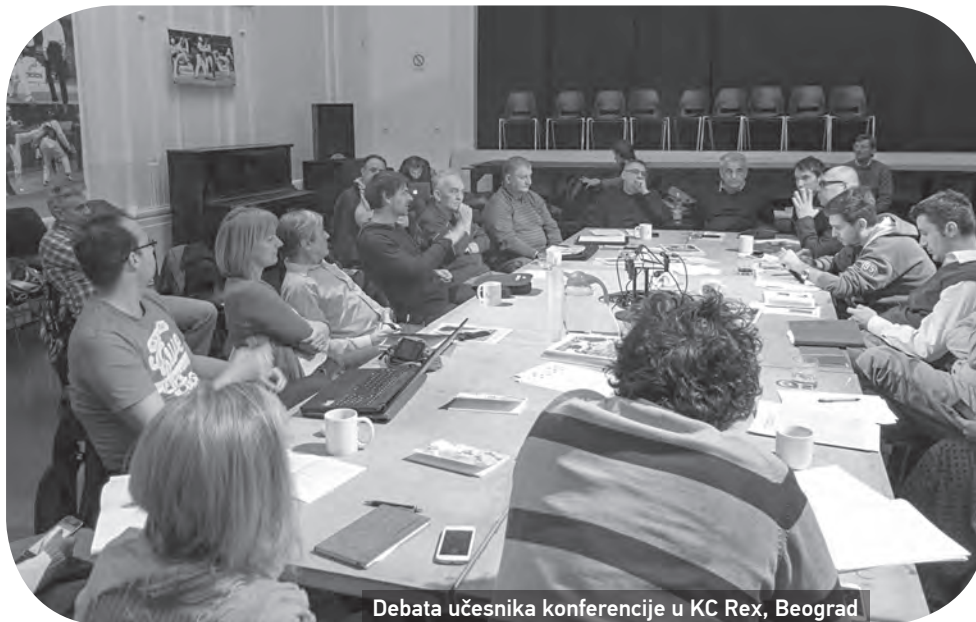
Debata učesnika konferencije u KC Rex, Beograd

Održavanje zgrade i grejanje samo su neki od troškova stanovanja koje je teško namiriti, kako zbog široko rasprostranjenog siromaštva, tako i zbog nejasnih odnosa između individualnog i zajedničkog vlasništva. Polazeći od napora koji daju